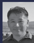
矢口 哲也 早稲田大学 創造理工学部 教授